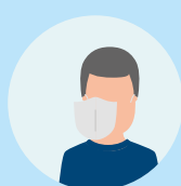
будні з маскою